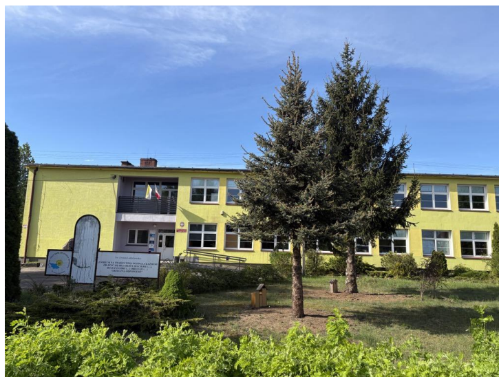
Szkoła Podstawowa w Drawskim Młynie