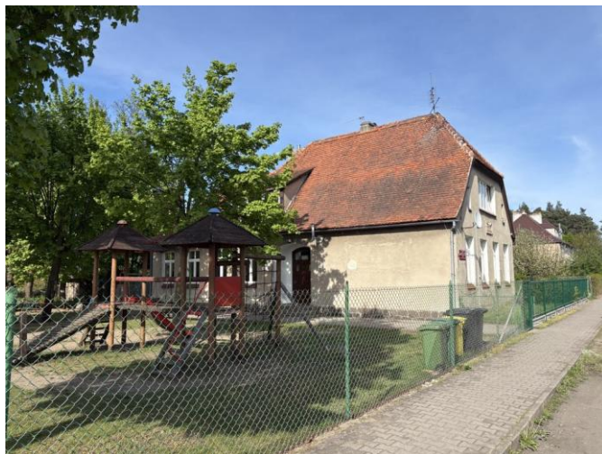
Budynek bylej szkoły, aktualnie filia oddział przedszkola