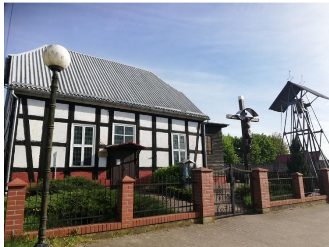
Kościół filialny Matki Boskiej Królowej Polski