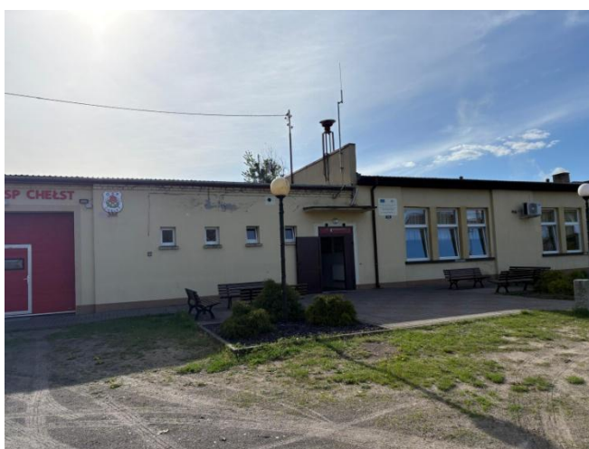
Świetlica wiejska, remiza OSP