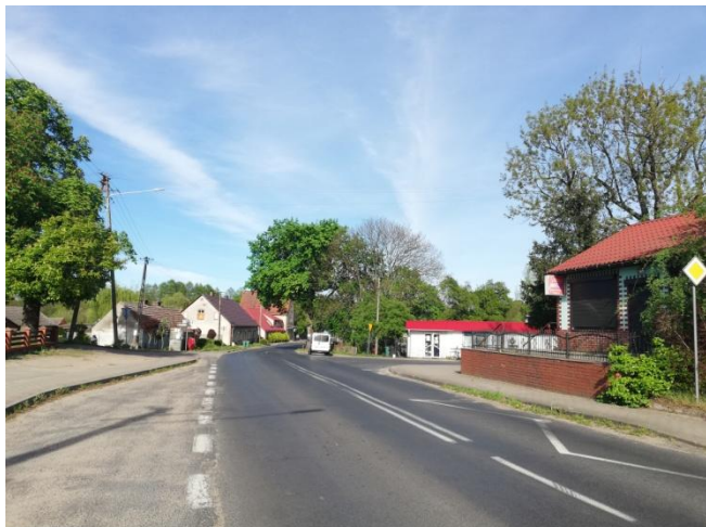
Droga przebiegająca przez miejscowość