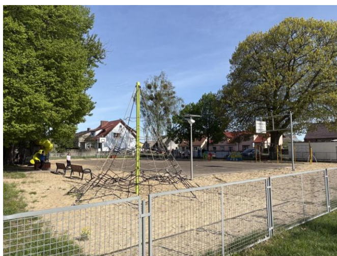
Plac zabaw w Drawsku