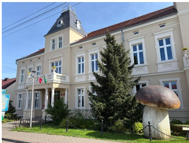
Budynek Urzędu Gminy Drawsko