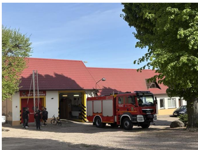
Remiza OSP Drawsko