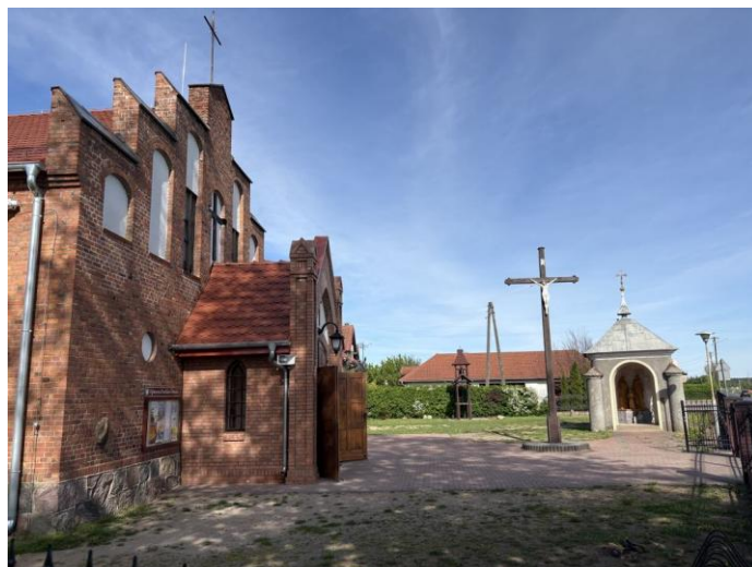
Kaplica i obiekty sakralne w Drawsku